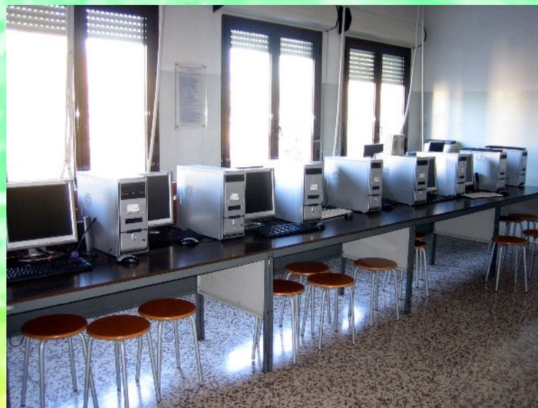
Laboratorio di informatica