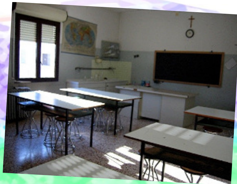
Laboratorio di scienze